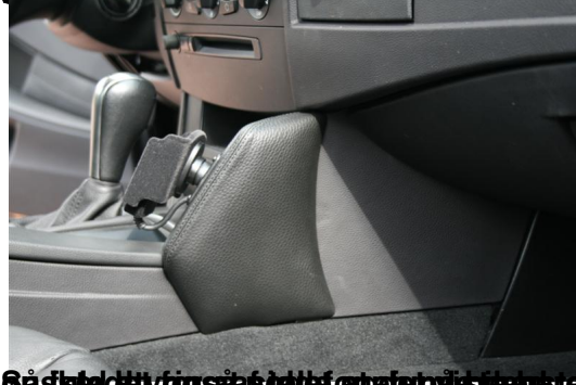
På den måde kan man se det gamle håndfri og det nye håndfri og det gamle håndfri kan se det nye håndfri og det gamle håndfri kan se det nye håndfri