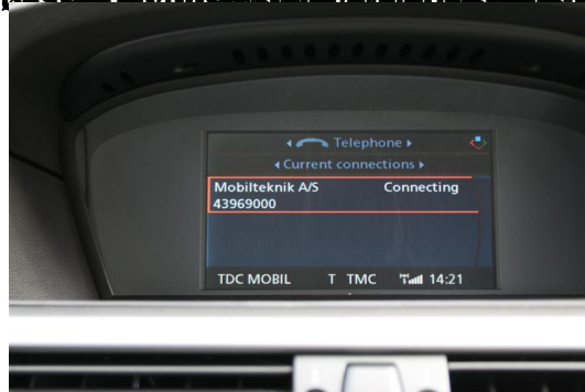
På den måde kan man se det gamle håndfri og det nye håndfri og det gamle håndfri kan se det nye håndfri