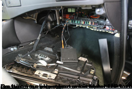
Da bilen blev monteret blev det gamle håndfri monteret på den originale Most system, for både køreren og passageren at se skiftet