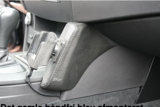
Det gamle håndfri blev afmonteret