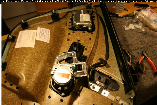
Så er det blot at samle dørene og montere ledninger til bilen.