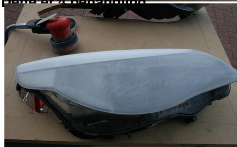
Dette er 5 behandling.