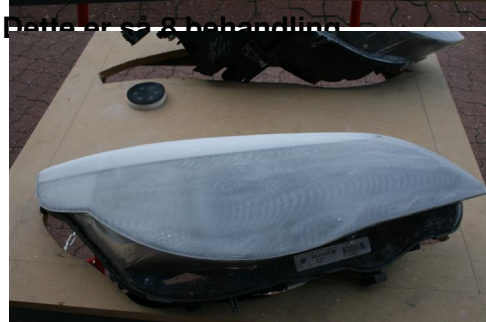
Dette er 8 behandling.